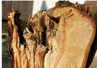
Oben: Pilze dringen in die Kappstelle ein und zerstören das Holz

An den großen Verletzungen dringen Holz zersetzende Pilze ein und schädigen das Holz.