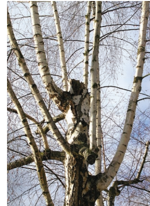
Rechts: Ständerbildung nach Kappung