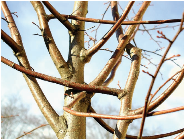
Reibende Äste: Hier ist fachgerechte Baumpfleß erforderlich

Fachgerechter Kronenschnitt beseitigt unerwünschte Entwicklungen wie reibende Äste und fördert den Baum in seiner Entwicklung. Das Entfernen von Ästen über 5 bzw. 10 cm birgt immer die Gefahr, dass Holz zersetzende Pilze eindringen und den Baum langfristig schädigen.