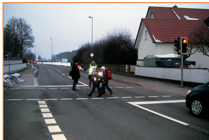
Fußgängerampel in der Kipfenberger Straße