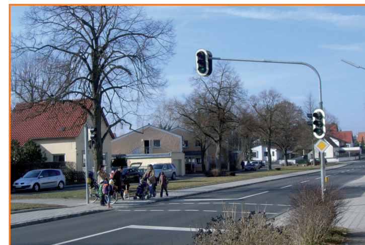
Fußgängerampel in der St.-Michael-Straße