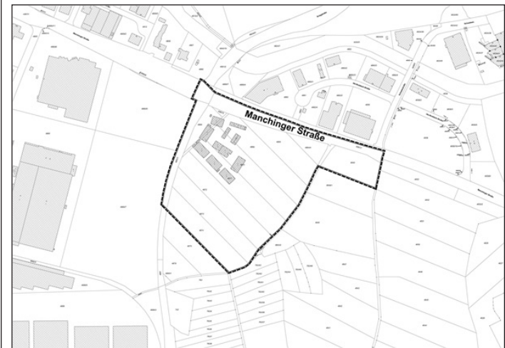
Lageplan zum Bebauungs- und Grünordnungsplan Nr. 177 V „GE südlich der Manchinger Straße“

Für Auskünfte und Erläuterungen stehen Mitarbeiter des Stadtplanungsamtes gerne zur Verfügung.