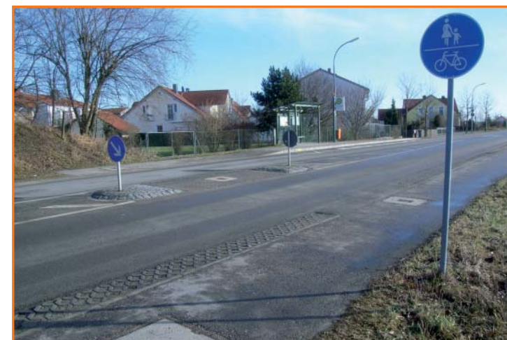
Querungshilfe in der Hofmarkstraße