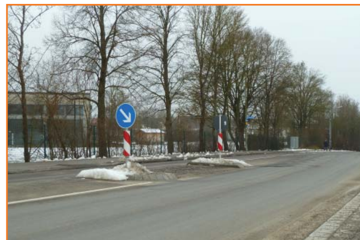
Querungshilfe in der Dreiländerstraße