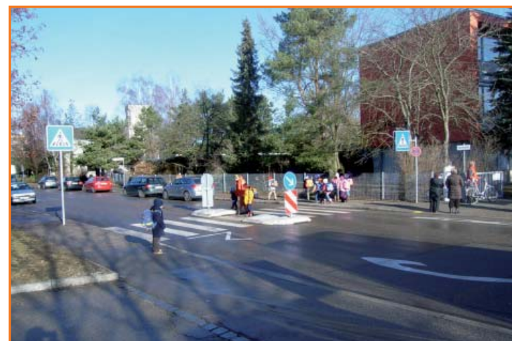
Fußgängerüberweg in der Jurastraße