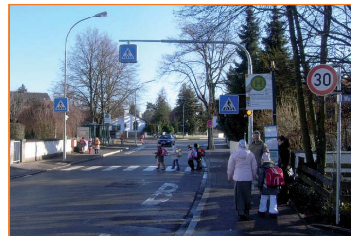
Fußgängerüberweg in der Schultheißstraße