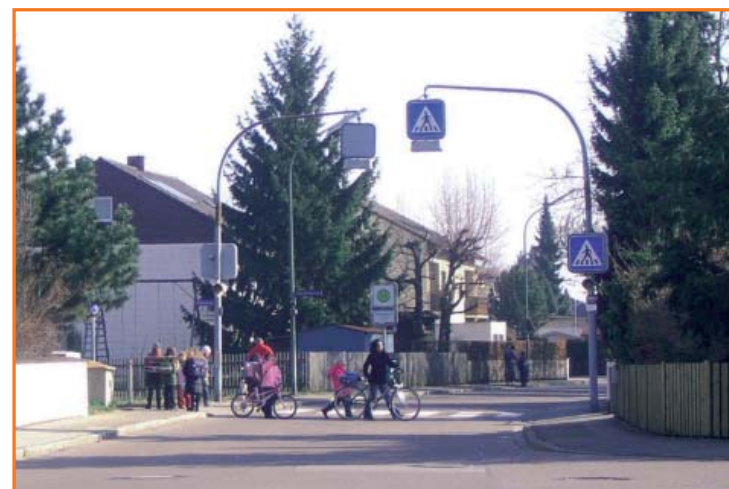
Fußgängerüberweg am Weckenweg