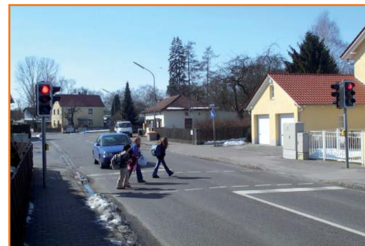
Fußgängerampel in der Beilngrieser Straße