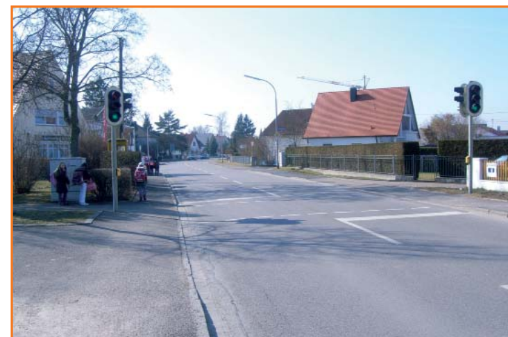
Fußgängerampel in der Regensburger Str.