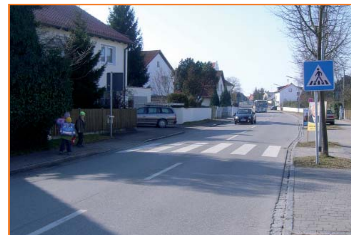
Fußgängerüberweg in der Regensburger Str.