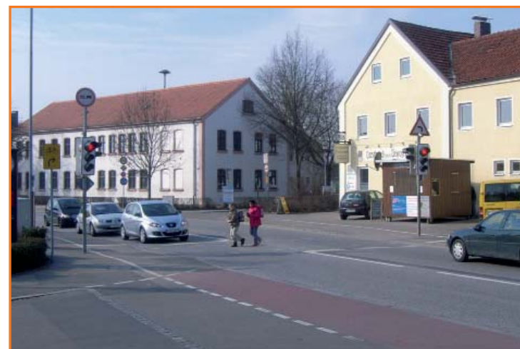
Fußgängerampel in der Münchener Straße