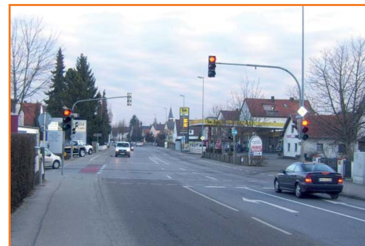
Fußgängerampel in der Münchener Straße