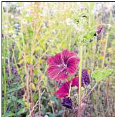
Die rund 300 städtischen Ausgleichsflächen sind ein wichtiger Lebensraum für Tiere und Pflanzen.

„In Abstimmung mit dem Umweltamt werden für jede Ausgleichsfläche, entsprechend dem ökologischen Entwicklungsziel, die Mäh-beziehungsweise Beweidungszeitpunkte festgelegt. Dabei wird auf das Düngen verzichtet und es werden nur tierschonende Mähgeräte verwendet. Einige Bereiche werden mit Blick auf die Tier- und Pflanzenwelt bewusst nicht gemäht“, erklärt Monika Weber, im städtischen Umweltamt für die Ausgleichsflächen zuständig. Um keine Wildtiere zu verletzen oder gar zu töten, wird vor jeder Mahd der zuständige Jagdpächter informiert, der die Wiesen kurz vor der Mahd begeht und kontrolliert. In jedem Jagdrevier werden darüber hinaus geeignete Ausgleichsflächen so umfassend gepflegt, damit strukturreiche, ungestörte Rückzugsräume für Rehe, Hasen, Fasane und Rebhühner vorhanden sind. „Mit diesen Maßnahmen leisten wir einen wichtigen Beitrag zur Bewahrung und Förderung der Artenvielfalt in unserer Stadt“, betont der Umweltreferent der Stadt Ingolstadt, Rupert Ebner.