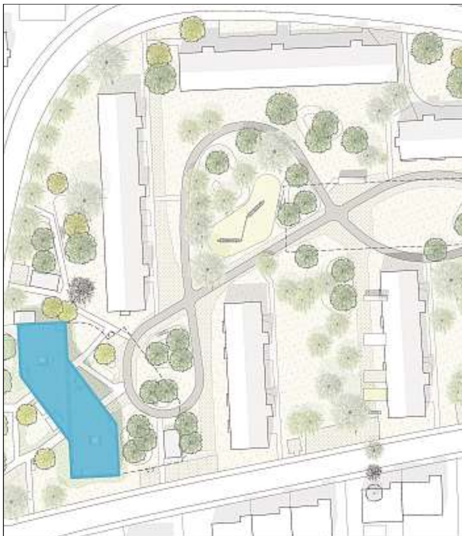
Bei der Planung des Neubaus (hier farbig gekennzeichnet) wird auch das gesamte Wohnumfeld miteinbezogen.

Die Ergänzungen direkt im Bestand erweitern die Möglichkeiten, neuen Wohnraum im Stadtgebiet zu schaffen. Darüber hinaus erfahren diese Gebiete eine Aufwertung im Bereich des Wohnumfeldes und die Bewohner profitieren von zusätzlichen Serviceangeboten. Die optimale Nutzung der Flächen ist also eine echte Win-win-Situation für die Stadt und viele neue Mieter, die hier bezahlbaren neuen Wohnraum finden. Das beachtliche Neubauprogramm der GWG kann also weitergehen.