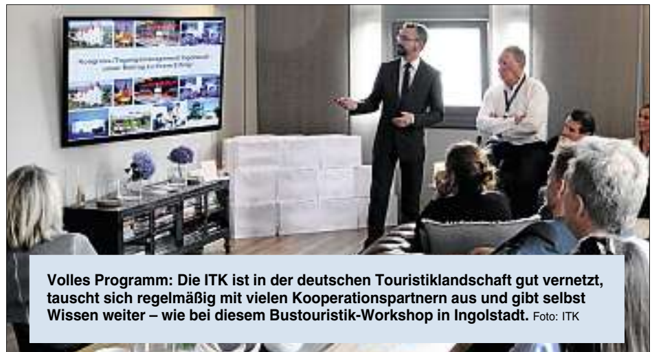
Volles Programm: Die ITK ist in der deutschen Touristiklandschaft gut vernetzt, tauscht sich regelmäßig mit vielen Kooperationspartnern aus und gibt selbst Wissen weiter – wie bei diesem Bustouristik-Workshop in Ingolstadt.

Wichtig seien aber auch die Kooperationen in der Region, etwa im Rahmen des Naturparks Altmühltal oder mit der Stadt Neuburg beim Jakobsweg, der vom Ingolstädter Münster über die Schlosskapelle Neuburg bis zum Kloster Bergen führt und