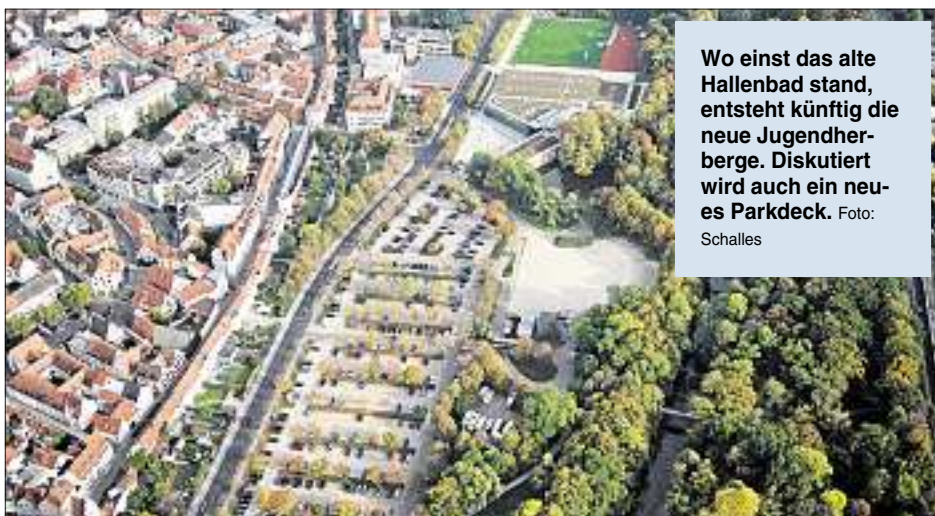
Wo einst das alte Hallenbad stand, entsteht künftig die neue Jugendherberge. Diskutiert wird auch ein neues Parkdeck.

beginnt für die neue Jugendherberge könnte im Sommer 2019, Fertigstellung im Herbst 2021 sein.