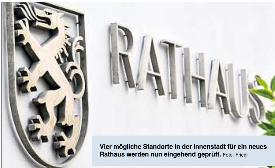
Vier mögliche Standorte in der Innenstadt für ein neues Rathaus werden nun eingehend geprüft.

Die Einwohnerzahl der Stadt wächst seit Jahren kontinuierlich. Um da Schritt zu halten, muss auch die Verwaltung mehr Mitarbeiter einstellen – und diese brauchen Platz. Weil die Kapazitäten in den bestehenden Rathäusern erschöpft sind und bereits einige Dienststellen in 26 Gebäuden ausgelagert werden mussten, wird auf lange Sicht der Bezug eines neuen, fünften Rathauses mit einer Fläche von 6000 Quadratmetern nötig. Der Standort dieses Verwaltungsgebäudes ist derzeit in den politischen Gremien in der Diskussion. Insgesamt sieben mögliche Standorte wurden nun im Zuge einer systematischen Vorprüfung unter die Lupe genommen, vier davon sind nun in der engeren Auswahl: Der Parkplatz an der Saturn-Arena, das Landratsamt-Gebäude Auf der Schanz, das ehemalige Donaukurier-Verlagshaus in der Donaustraße sowie der Hauptbahnhof.