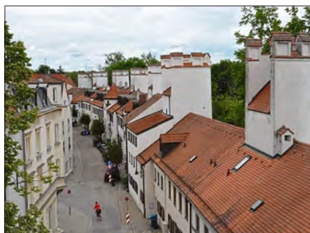
Am Unteren Graben sind die Stadtmauertürme noch besonders originalgetreu erhalten.

Zwei Drittel der reinen Instandsetzungskosten zuzüglich der Aufwendungen für die Turm- und Zinnenrekonstruktion und den Abbruch von Anbauten sollen von der Stadt Ingolstadt übernommen werden, die ihrerseits mit finanzieller Unterstützung im Rahmen der Städtebauförderung durch den Freistaat Bayern rechnen kann. Wie bereits in der Vergangenheit, sind auch bei den zukünftigen Sanierungsmaßnahmen denkmalbedingte Auflagen zu beachten. Neben der Verwendung bestimmter Materialien, dem Einbau von Holzfenstern und der Vorgabe, die Stadtmauer weiß zu streichen, soll auch der Stadtmauervorbereich zukünftig verstärkt im Mittelpunkt stehen, um das ursprüngliche, mittelalterliche Erscheinungsbild wiederzuerlangen. „Ein wichtiges Anliegen ist mir, die Erinnerung an unsere Heimatgeschichte zu pflegen und für künftige Generationen zu bewahren. Auch die Stadtmauer gehört als wichtiger Teil zu unserer Heimatgeschichte. Dieses Programm soll das Baudenkmal Stadtmauer stärken und die geschichtlich korrekte Restaurierung einleiten. Türme und Zinnen sollen wieder dorthin, wo sie hingehören. Man muss sich auf seine eigene Stadtidentität nicht nur berufen, sondern sie auch zeigen – im historisch korrekten Zustand“, so Oberbürgermeister Christian Lösel.