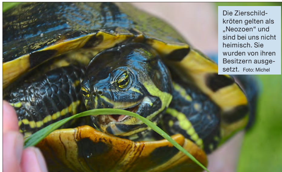
Die Zierschildkröten gelten als „Neozoen“ und sind bei uns nicht heimisch. Sie wurden von ihren Besitzern ausgesetzt.

nungswidrigkeit, die mit einer hohen Geldbuße geahndet werden kann. Es wird deshalb dringend empfohlen, sich schon vor dem Kauf eines Tieres genau zu informieren, welche Bedürfnisse es hat und ob die-