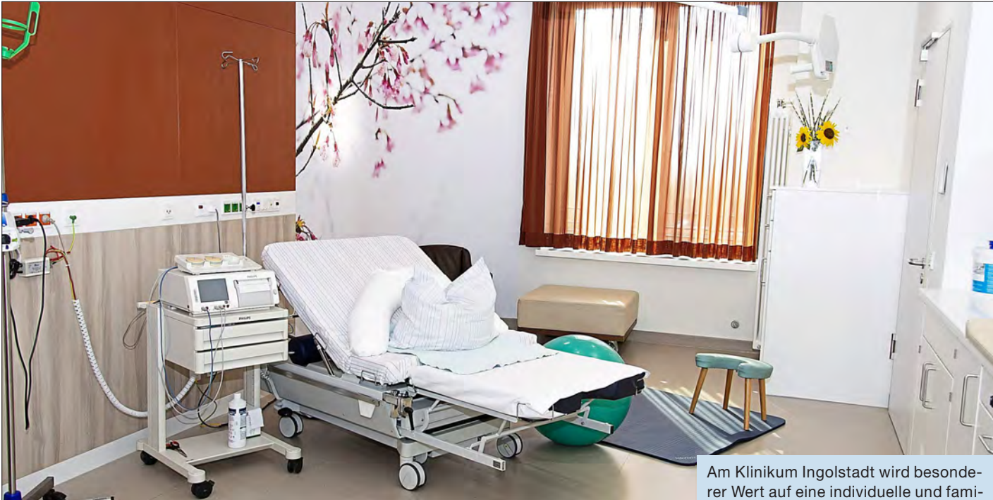
Am Klinikum Ingolstadt wird besonderer Wert auf eine individuelle und familienorientierte Betreuung gelegt. Der neue Kreißsaal bietet eine angenehme Atmosphäre.

schen Sicherheitsstufe, bietet das Klinikum Ingolstadt vor, während und nach der Geburt das volle medizinische Spektrum für Baby und Mutter an“, erklärt der Facharzt für Geburtshilfe. Im Rahmen des Perinatalzentrums arbeiten die Ingolstädter mit der Klinik für Kinderheilkunde und Jugendmedizin St. Elisabeth in Neuburg a. D. zusammen, die am Klinikum eine Außenstelle betreibt. „Unsere Kreißsäle befinden sich direkt zwischen der Kinderintensivstation und dem OP-Bereich. Mit dieser Wand-an-Wand-Lösung stellen wir kurze Wege und eine schnelle Behandlung sicher“, beschreibt Professor Aydeniz das Notfallnetz: „Bei Bedarf können wir außerdem auf die Kinderchirurgie sowie in der Kindermedizin erfahrene Anästhesisten zurückgreifen.“ Das Perinatalzentrum in Ingolstadt ist im Umkreis von rund 60 Kilometern das einzige, das mit der höchsten Sicherheitsstufe zertifiziert ist. In einem der großen geburtshilflichen Zentren in Deutschland benötigen rund zehn Prozent der Neugeborenen – geplant oder ungeplant – die Kompetenzen des Perinatalzentrums.