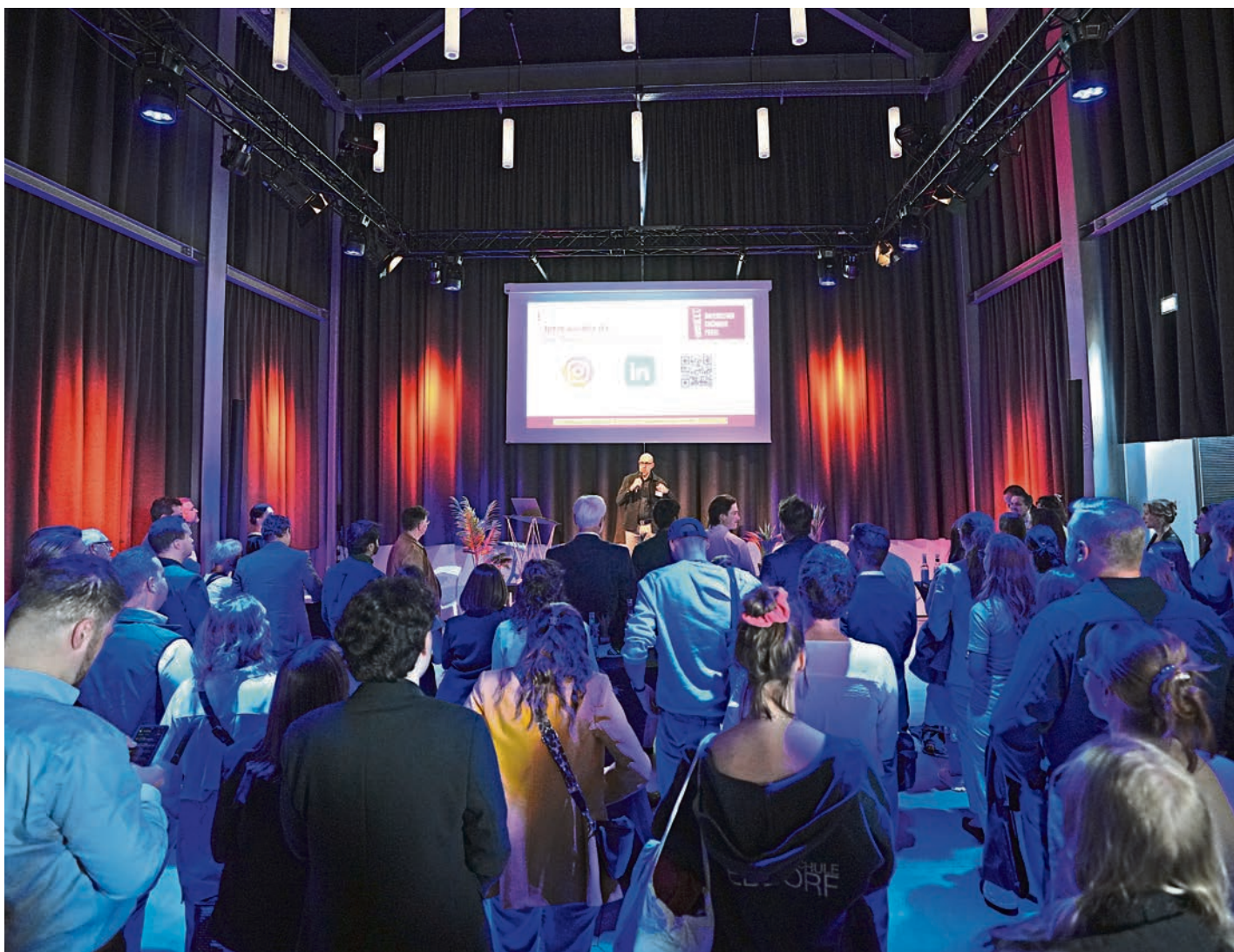
Großer Andrang bei der Nacht der Bewerber

Jetzt abstimmen und die Gründungsszene aktiv mitgestalten