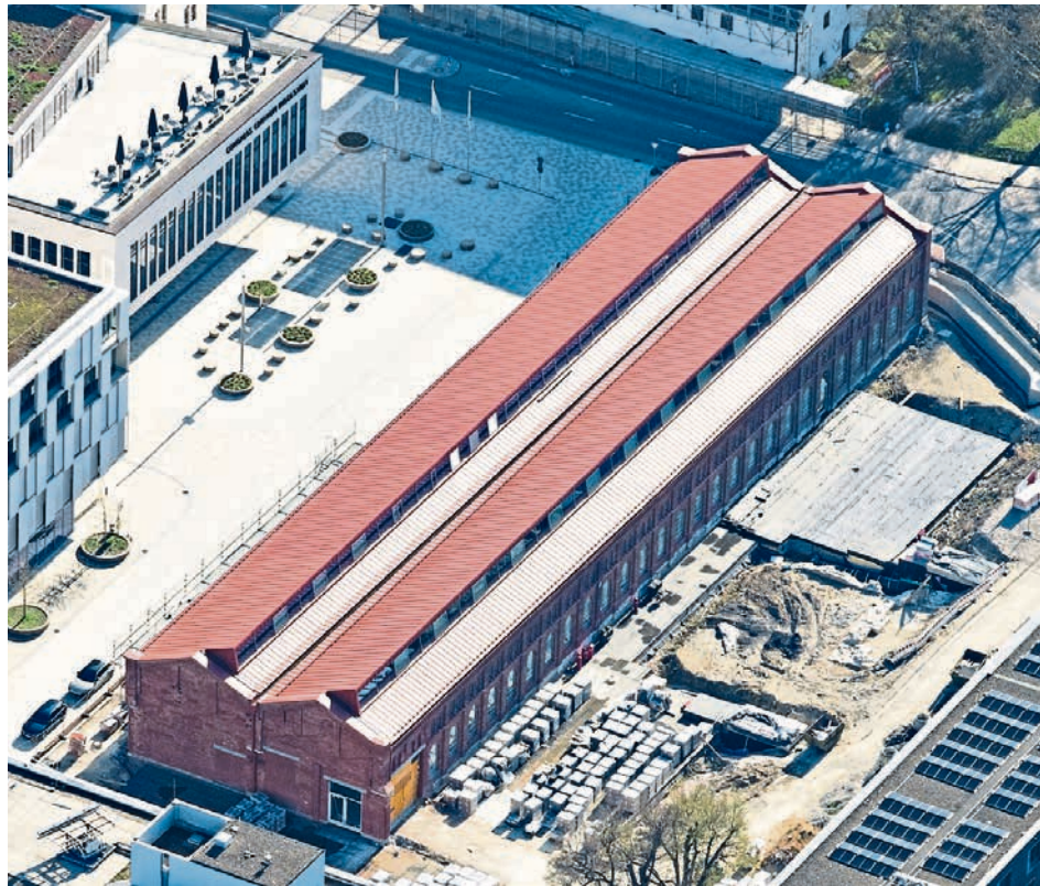
Sieht schon sehr gut aus: Die umgebaute alte Gießereihalle wird künftig neue Heimat des Museums für Konkrete Kunst und Design.

Ergänzt wird die Ausstellung durch ausgewählte Kunstwerke und Designobjekte aus den Sammlungen von Museum und der Stiftung für Konkrete Kunst und Design, sowie einer Installation von Sven Völker zu „Das Museum der Formen“, dem Kinderbuch des MKKD. Ein mobiler Pop-