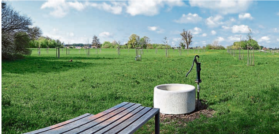
Zum Picknicken auf die Streuobstwiese? Kein Problem in Unsernherrn! An der Dorfstraße ist eine tolle Ergänzung zum nahen Bolz- und Hockeyplatz entstanden.