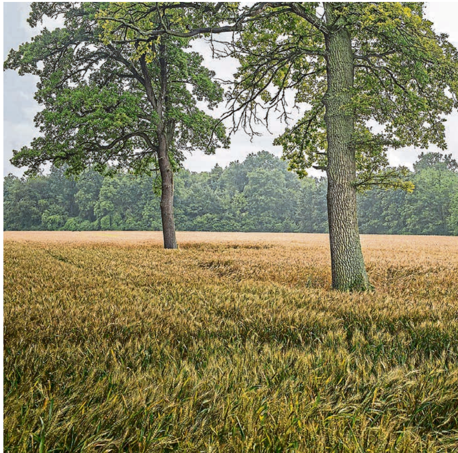
Fotografien des Künstlers Anton Brandl zum Gerolfinger Eichenwald werden noch bis Saisonende im Bauerngerätemuseum gezeigt.

Der Erhalt des Gerolfinger Eichenwalds mit seiner Mischung historischer, teilweise parkartiger Landschaftselemente ist seit den Anfängen der Ingolstädter Kreisgruppe des BUND Naturschutz Ort der Identifikation und Motivation – und auch unvergesslicher Waldfeste. Zu ihrem 50-jährigen Jubiläum in diesem Jahr widmet die Ingolstädter Kreisgruppe deshalb gemeinsam mit dem Bauerngerätemuseum dem Gerolfinger Eichenwald diese Ausstellung. Vor 50 Jahren, im Jahr 1976, als die Ingol-