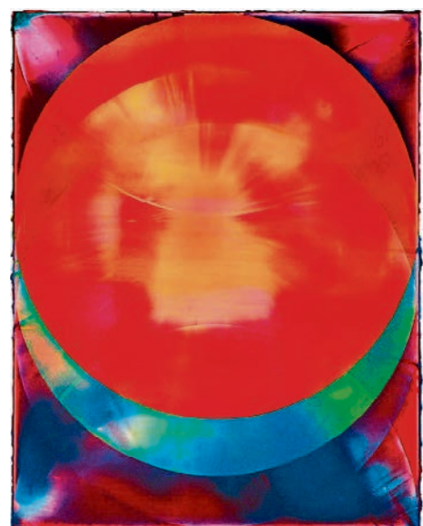
Shannon Finley - Sunset, © Shannon Finley.