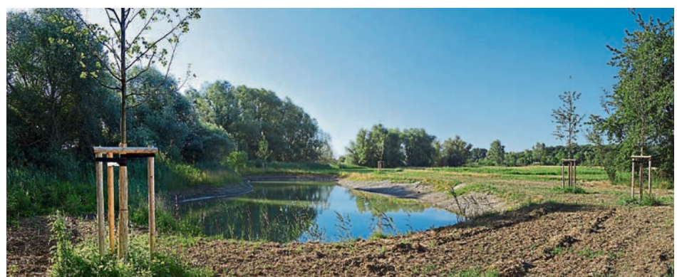
Der neue Abschnitt der Einbogenlohe – auch hier wurde das Grundwasser freigelegt und heimische Gehölze gepflanzt.