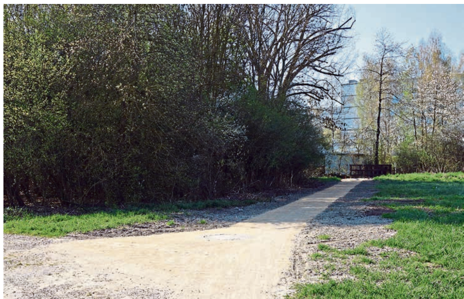
Der neue Gehweg verbessert die Anbindung der Freiflächen nördlich und südlich des Haunstädter Mühlbachs.

Bausumme: voraussichtlich 1,78 Millionen Euro