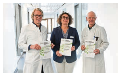
Wieder ausgezeichnet Darmkrebszentrum am Klinikum rezertifiziert