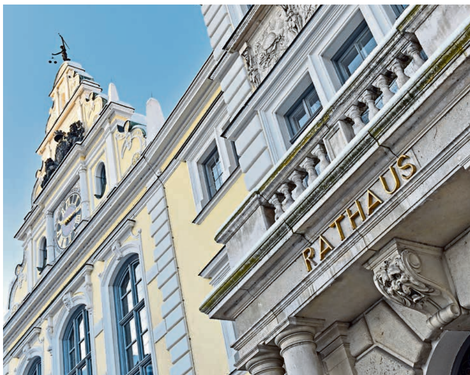
Keine leichten Zeiten für das Ingolstädter Rathaus: Aufgrund der angespannten Haushalts-situation ist das finanzielle Handeln der Stadt zunächst eingeschränkt.

Laufende Maßnahmen für zentrale Pflichtaufgaben sollen fortgeführt werden – etwa im Schulbereich oder beim Erhalt der Infrastruktur. Allerdings sind hierzu neue Kredite nötig, für die Zins und Tilgung zu leisten sind. Nur wenn ihre Finanzierung