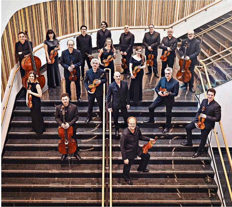
Neue Heimat für die Kammerphilharmonie: Ab 2027 spielt das Ensemble im Congress Centrum.