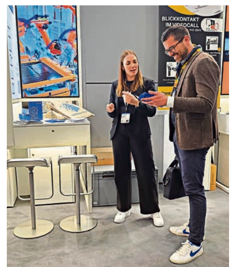
Informationsaustausch am Messestand

Weitere Informationen zu dem Projekt unter www.transform-10.de