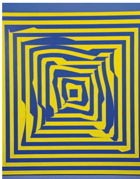
Vera Molnár - Hypertransformation Jaune-Violet A-2, © VG Bild-Kunst, Bonn 2026. Foto: Klotzeck

es im Laufe des Jahres bei ausgewählten Veranstaltungen geben. Die neue Ausstellung hat am Dienstag, Mittwoch, Samstag und Sonntag von 10 bis 17 Uhr in den (alten) Räumlichkeiten in der Tränktorstraße geöffnet.