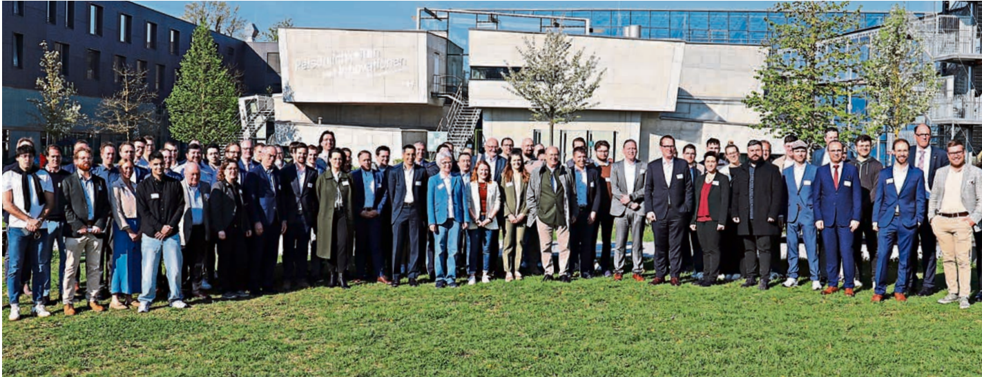
Über 100 Teilnehmende der Urban Air Mobility-Initiative trafen sich zum Netzwerktreffen in Ingolstadt.