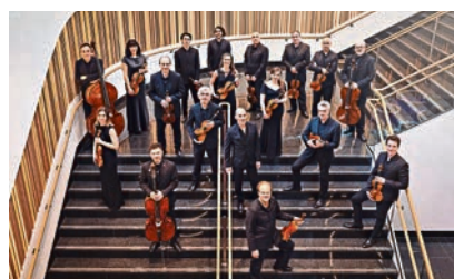
Musik im Maritim Neuer Spielort für Kammerphilharmonie ab 2027

Neu gewählter Stadtrat hat die Arbeit aufgenommen