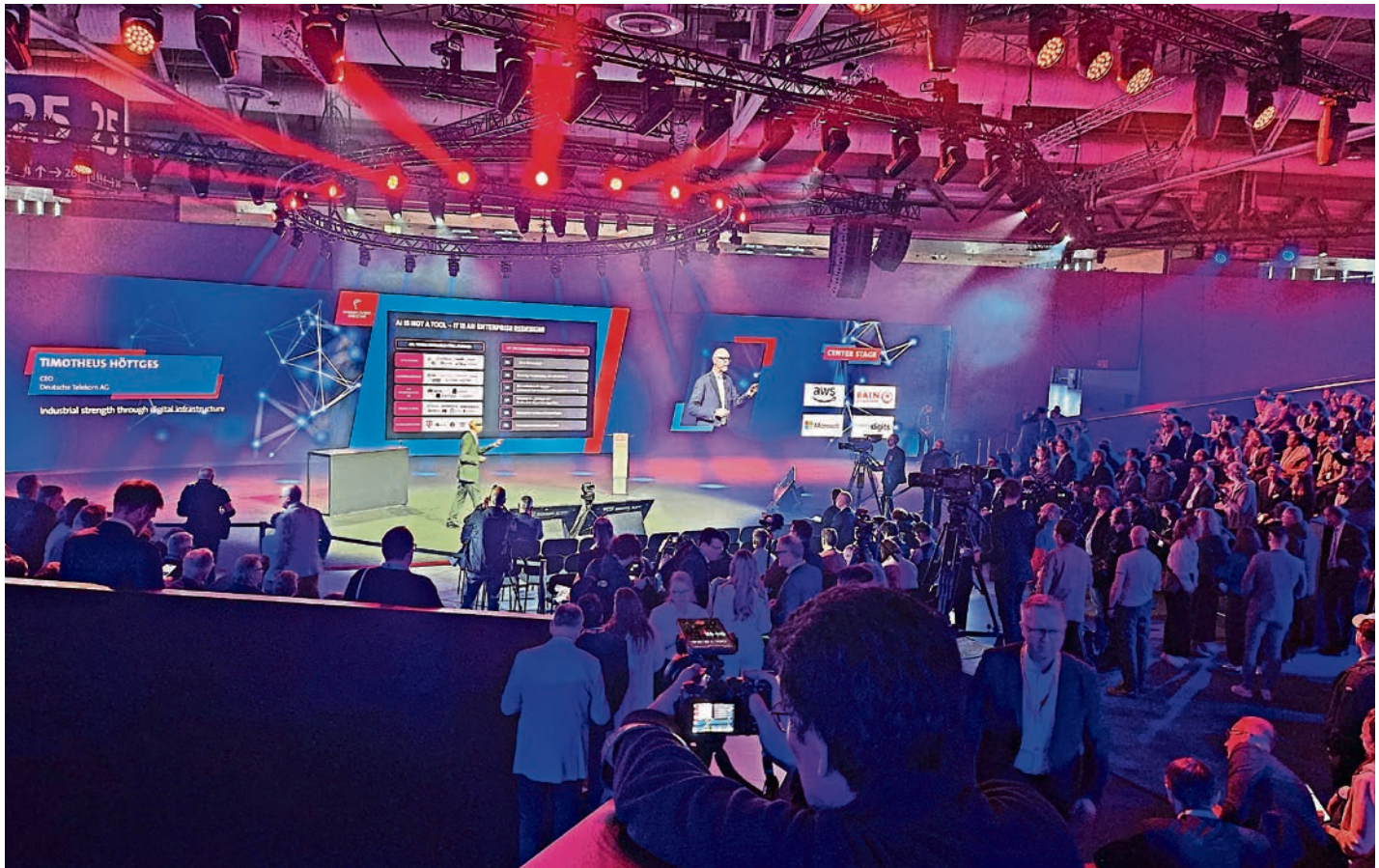
Eröffnung der Hannover Messe