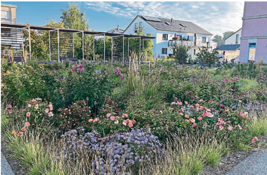
Der ehemalige Rosengarten in Oberhaunstadt wurde zum grünen Mittelpunkt des neuen Stadtquartiers im Neubaugebiet „Am Kreuzäcker“ umgestaltet.