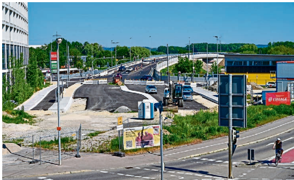
Die neue Brücke über die Bahnlinie ist bereits für den Verkehr freigegeben, die Marktkaufkreuzung davor wird nun umgebaut.

aus der Nürnberger Straße an der Marktkaufkreuzung ankommt, wird nach links und rechts in die Theodor-Heuss-Straße geführt. Kurz vor der Theodor-Heuss-Brücke besteht die Möglichkeit, in die Siemensstraße abzubiegen, zur neuen Brücke am Schneller Weg. Wer von Osten (aus Richtung Autobahn) kommt, kann an der Marktkaufkreuzung künftig nur noch geradeaus fahren und nicht mehr nach Süden, in Richtung Schillerbrücke abbiegen. Die Stadt bittet alle Verkehrsteilnehmer, Kreuzungsbereiche bei Rückstau freizu-