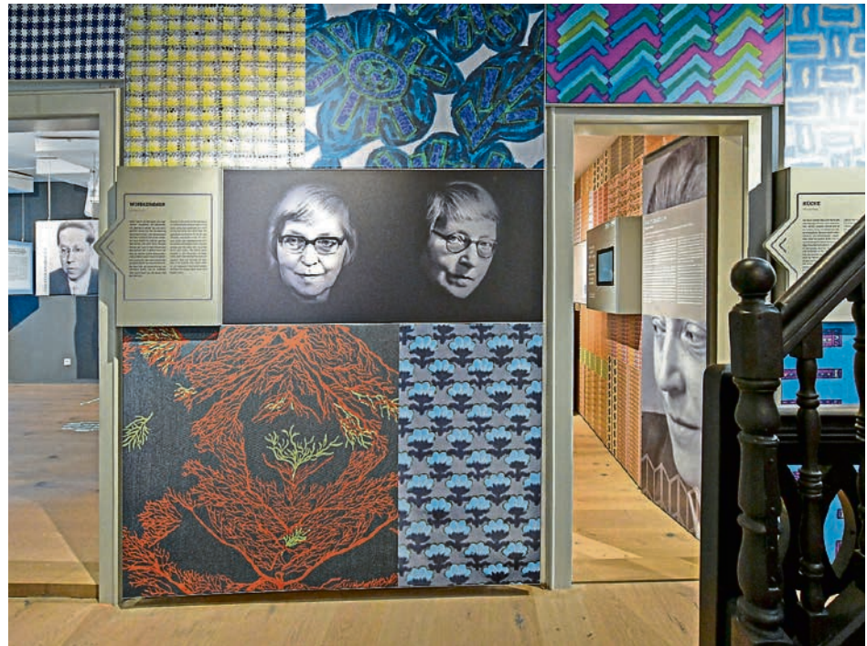
Das Fleißerhaus in der Kupferstraße.