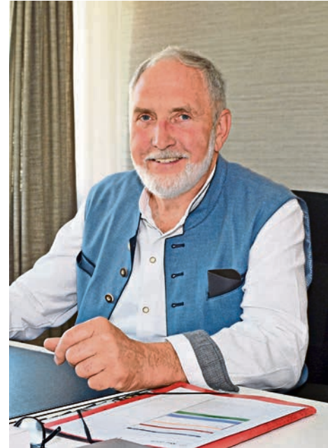
Zweiter Bürgermeister Franz Wöhl.

„Mir ist vor allem eine offene und ehrliche Kommunikation wichtig, weil ich weiß, dass viele Menschen verunsichert sind. Natürlich werden wir sparen müssen, aber nicht überall in gleichem Maße. Die sogenannte ‚Rasenmäher-Methode‘, also überall denselben Prozentsatz einzusparen, stößt irgendwann an ihre Grenzen. Deshalb müssen wir jeden Bereich genau anschauen. Es wird Felder geben, in denen größere Einsparungen möglich sind, und andere, in denen tiefe Einschnitte Strukturen zerstören würden, die sich später kaum wieder aufbauen lassen. Auf der Einnahmenseite