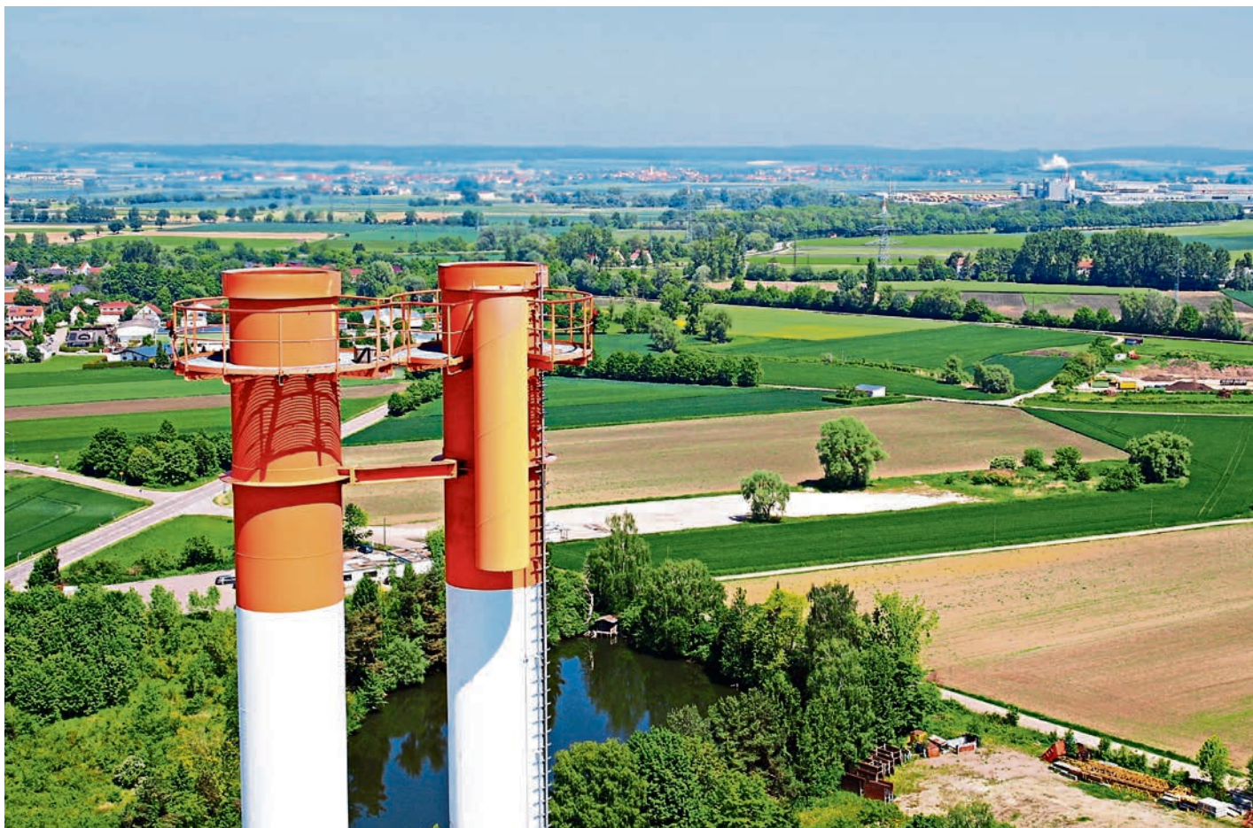
Hoch hinaus für Umwelt und Region – die 80 m hohen Kamine der MVA Ingolstadt.