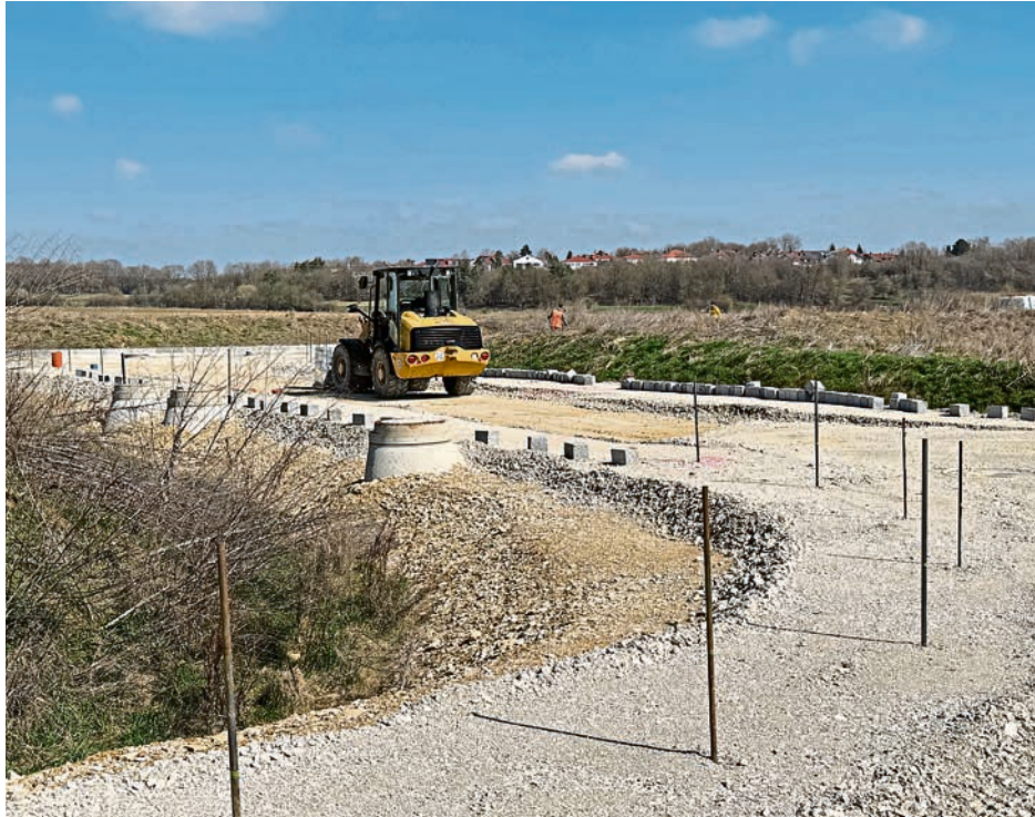
Stabile Bodenrichtwerte sind zum Beispiel in Etting zu verzeichnen; im Bild die Baustelle für die Entwicklung des Baugebietes „Am Steinbuckl“.

Immobilienmarkt: Unterschiede zwischen den einzelnen Stadtteilen