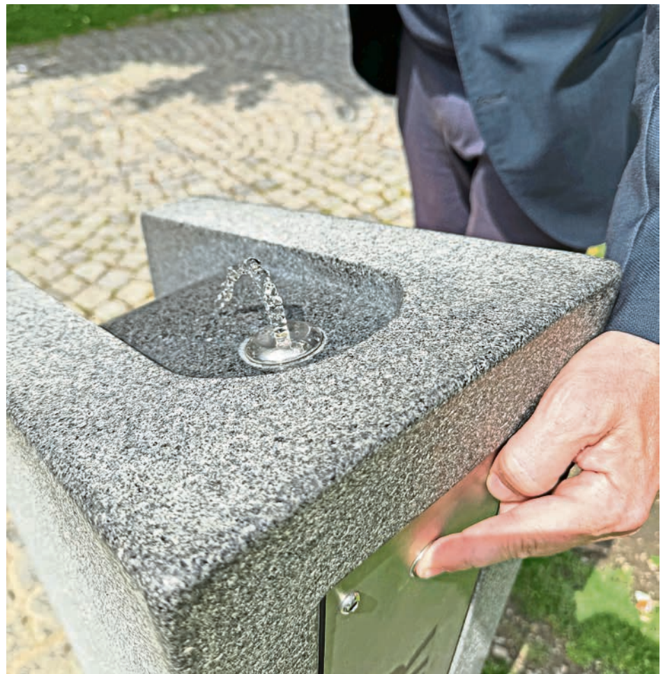
Trinkwasserbrunnen gibt es an mehreren Stellen in der Altstadt. Auf der neuen Online-Karte sind die genauen Standorte verzeichnet.

ist und wo man sich erholen kann. Das neue Angebot macht die Stadt ein Stück lebenswerter – und hilft allen, den Sommer in Ingolstadt gesünder zu genießen.