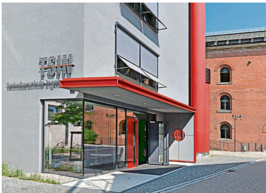
Die Technikerschule in der Adolf-Kolping-Straße.

Die Schülerinnen und Schüler besuchen nur drei Jahre lang an zwei festgelegten Wochentagen die Technikerschule in Präsenz.