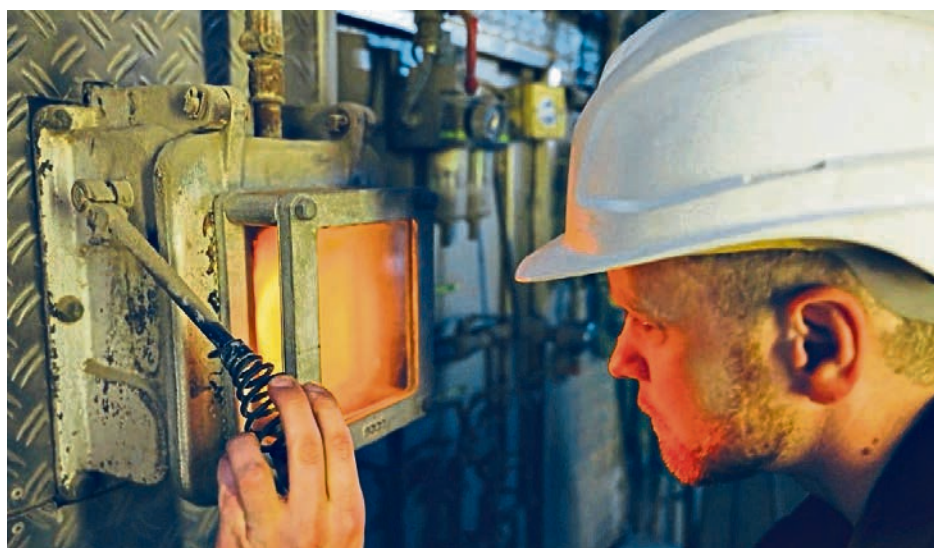
Wo andere nur Müll sehen, beginnt in der MVA Ingolstadt ein wichtiger Kreislauf für Umwelt, Ressourcen und Energie.

Umwelterklärungen sind weit mehr als eine formale Pflicht. Am Beispiel der MVA Ingolstadt wird deutlich, dass moderne Müllverwertungsanlagen einen wichtigen Beitrag zu Transparenz, Umweltschutz und gesellschaftlicher Akzeptanz leisten und zugleich eine nachhaltige Zukunft aktiv mitgestalten.