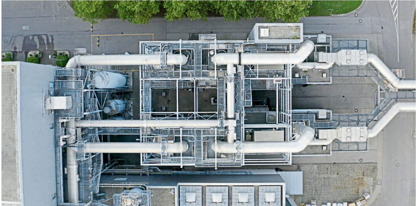
Was hier wie ein komplexes Labyrinth aus Rohren wirkt, ist ein zentraler Baustein für der Rauchgasreinigung der Müllverwertungsanlage.

Müllverwertungsanlagen leisten einen zentralen Beitrag zur sicheren Entsorgung von Abfällen und zur nachhaltigen Energiegewinnung. Um dieser Verantwortung gerecht zu werden, sind viele Anlagen verpflichtet, regelmäßig sogenannte Umwelterklärungen zu veröffentlichen. Diese Berichte schaffen Transparenz, dokumentieren Umweltleistungen und informieren die Öffentlichkeit nachvollziehbar über Emissionen, Energieeffizienz und Verbesserungsmaßnahmen. Ein besonders anschauliches Beispiel hierfür ist der Zweckverband Müllverwertungsanlage Ingolstadt (MVA).