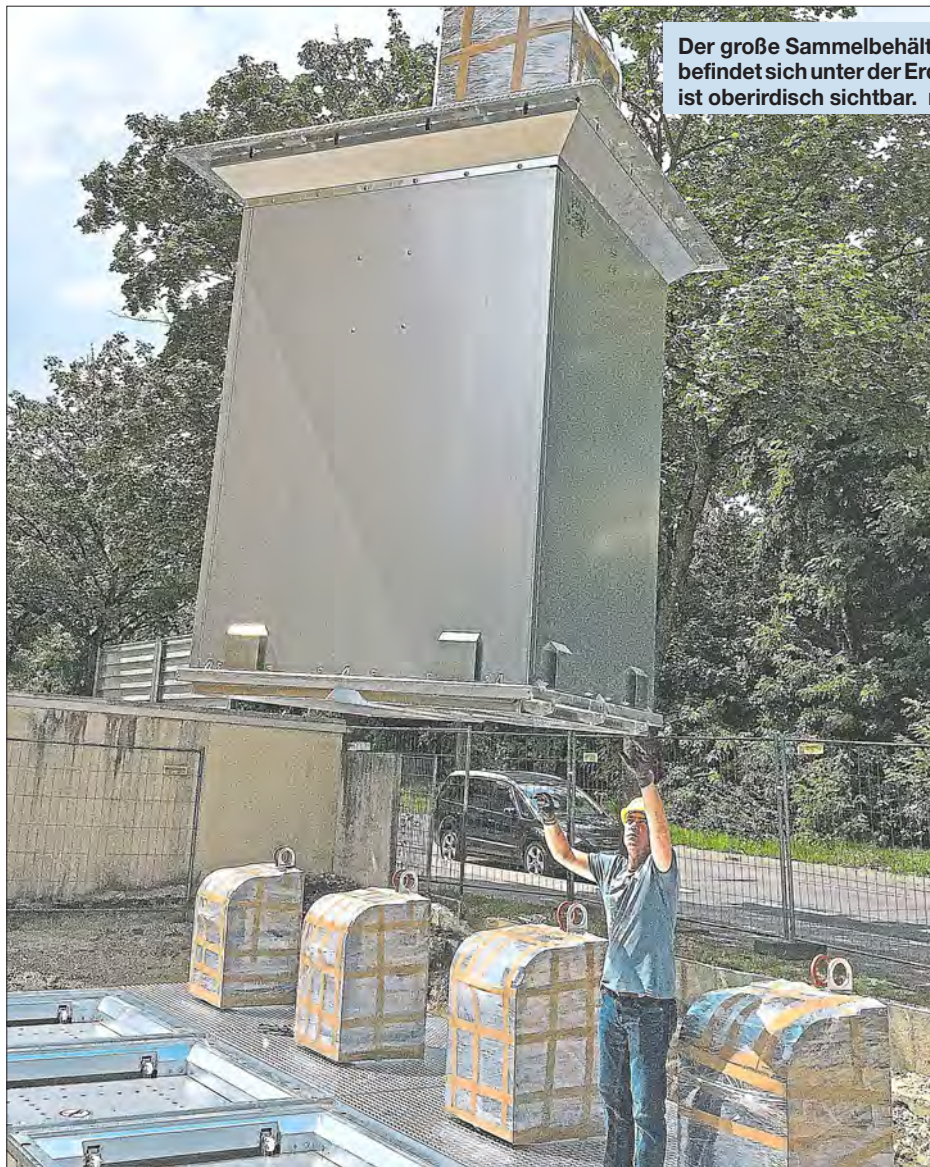
Der große Sammelbehälter des neuen Unterflursystems befindet sich unter der Erde. Lediglich der Einwurfschacht ist oberirdisch sichtbar.

GWG und Kommunalbetriebe starten Pilotprojekt