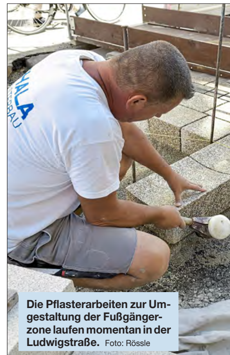
Die Pflasterarbeiten zur Umgestaltung der Fußgängerzone laufen momentan in der Ludwigstraße.

Klar könnte man auch die gesamte Fußgängerzone auf einmal sanieren und dabei beträchtlich viel Zeit sparen. Aber: Eine Komplettspernung ist keine Option, denn die Fußgängerzone kann nicht gesperrt werden, der Betrieb läuft ja weiter. Die Geschäfte, Lokale und Wohnhäuser müssen zugänglich sein, Rettungs- und Lieferwege freigehalten werden und Passanten queren können. Hinzu kommt, dass es zum Beispiel für die Spartenräger ganz unterschiedliche Fachfirmen gibt, die die Besonderheiten ihres Bereichs kennen – es kann nicht jeder