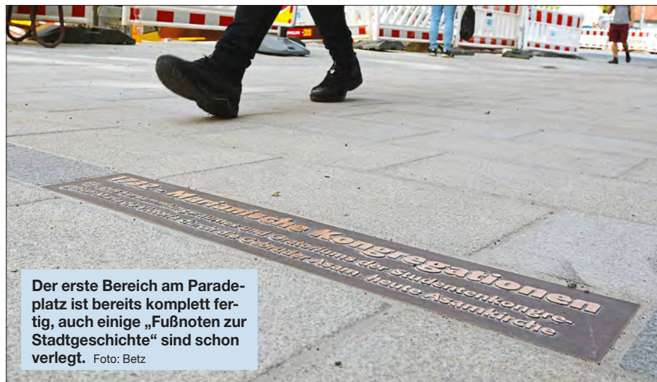
Der erste Bereich am Paradeplatz ist bereits komplett fertig, auch einige „Fußnoten zur Stadtgeschichte“ sind schon verlegt.

Die Anlieger werden über den Baufortschritt unmittelbar informiert. Auf der Internetseite www.ingolstadt.de/fgz sind für die Öffentlichkeit Informationen zum aktuellen Verlauf und zum Projekt an sich enthalten.