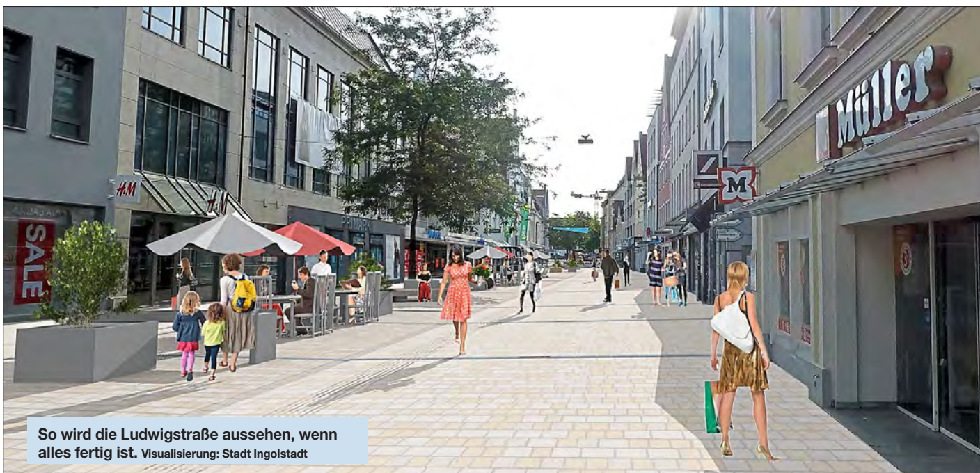
So wird die Ludwigstraße aussehen, wenn alles fertig ist.