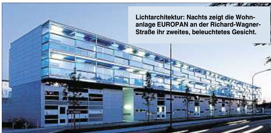
Lichtarchitektur: Nachts zeigt die Wohnanlage EUROPAN an der Richard-Wagner-Straße ihr zweites, beleuchtetes Gesicht.

Zahlreiche Preise und Auszeichnungen für die verschiedenen Bauprojekte in den letzten Jahren bestätigen die GWG in ihrem Handeln. Als größtes Wohnungsbaunternehmen in der Region bringt sich die Gemeinnützige Wohnungsbaugesellschaft aktiv ein, um das Stadtbild mitzugestalten und zu verändern und gibt damit – gerade auch unter dem Aspekt der sozialen Verantwortung – richtungweisende Impulse für das zukünftige Wohnen und Leben in Ingolstadt.