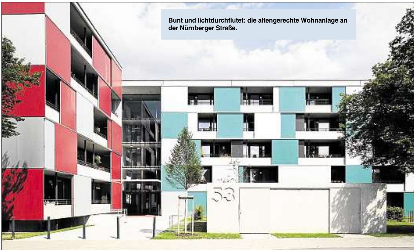
Bunt und lichtdurchflutet: die altengerechte Wohnanlage an der Nürnberger Straße.

und sollen den qualitativ hohen Anspruch an das „Wohnen von heute“ widerspiegeln.