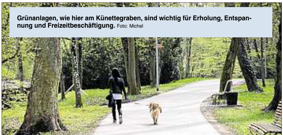
Grünanlagen, wie hier am Künettegraben, sind wichtig für Erholung, Entspannung und Freizeitbeschäftigung.

In 18 größeren und kleineren Städten wurden insgesamt rund 9500 Personen zur Zufriedenheit mit den städtischen Grünflächen befragt. Das wichtigste Ergebnis: Rund 98 Prozent finden Grün- und Park-