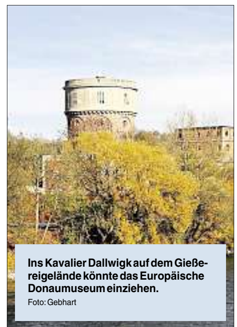
Ins Kavalier Dallwig auf dem Gießereigelände könnte das Europäische Donaumuseum einziehen.

Vor allem hierbei wird es für Ingolstadt interessant: Denn eines von drei Donaumuseen könnte bei uns (im Kavalier Dallwig auf dem Gießereigelände) realisiert werden. Am Oberlauf der Donau ist Ingolstadt bislang der einzige Interessent für die Errichtung eines solchen Europäischen Donaumuseums. Weitere Ausstellungsstätten sollen in Ungarn und am Delta in Rumänien entstehen. „Bisher gibt es nur kleinere Museen, die nur regionale Teilbereiche aufgreifen“, weiß Schneider. Mit den drei großen Museen könnten erstmals sämtliche Aspekte aufgegriffen werden. Auch hierbei kann Ingolstadt unter Umständen von den Netzwerk-Partnern profitieren – zum Beispiel wenn es um Exponate und Inhalte geht. „Das gemeinsame Ziel ist es, den Bewohnern und Besuchern die Naturschätze des Donaurooms näherzubringen und ein authentisches Naturerlebnis zu vermitteln“, erklärt Schneider.