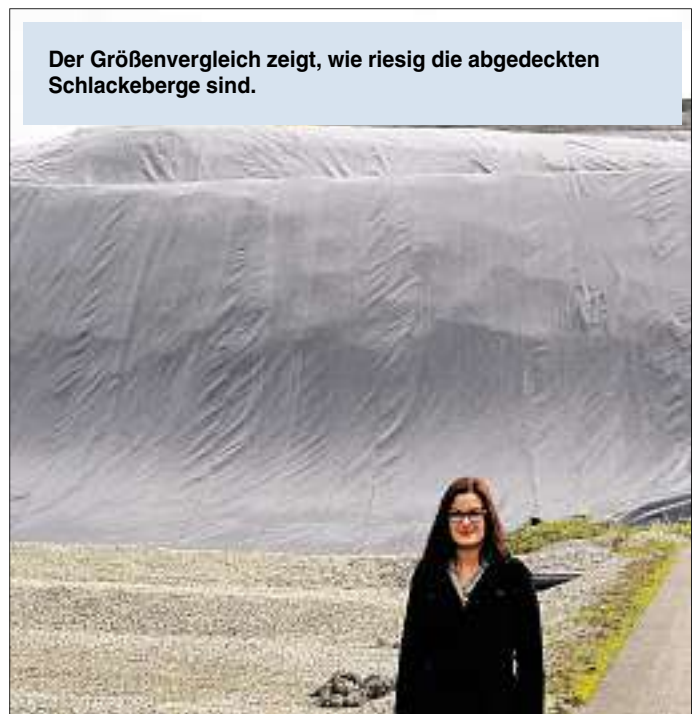
Der Größenvergleich zeigt, wie riesig die abgedeckten Schlackeberge sind.

Die nach dem Zweiten Weltkrieg mit dem stetigen Wirtschaftswachstum entstandenen Müllberge sind jahrzehntelang auf Deponien entsorgt worden. Welche Belastungen durch solche Lagerstätten entstehen können, war damals nicht absehbar. 1968 wurde bei Eberstetten im Landkreis Pfaffenhofen eine Mülldeponie errichtet, die der Zweckverband Müllverwertungsanlage Ingolstadt (ZV) 1985 vom Landkreis übernommen und kontinuierlich den modernen Anforderungen des Umweltschutzes angepasst hat. Mit der Übernahme der Deponie durch den Zweckverband kann nicht nur eine langfristige Betreuung über Jahrzehnte gewährleistet werden, sondern auch ein Beitrag zur ökologischen Energieerzeugung geleistet werden.