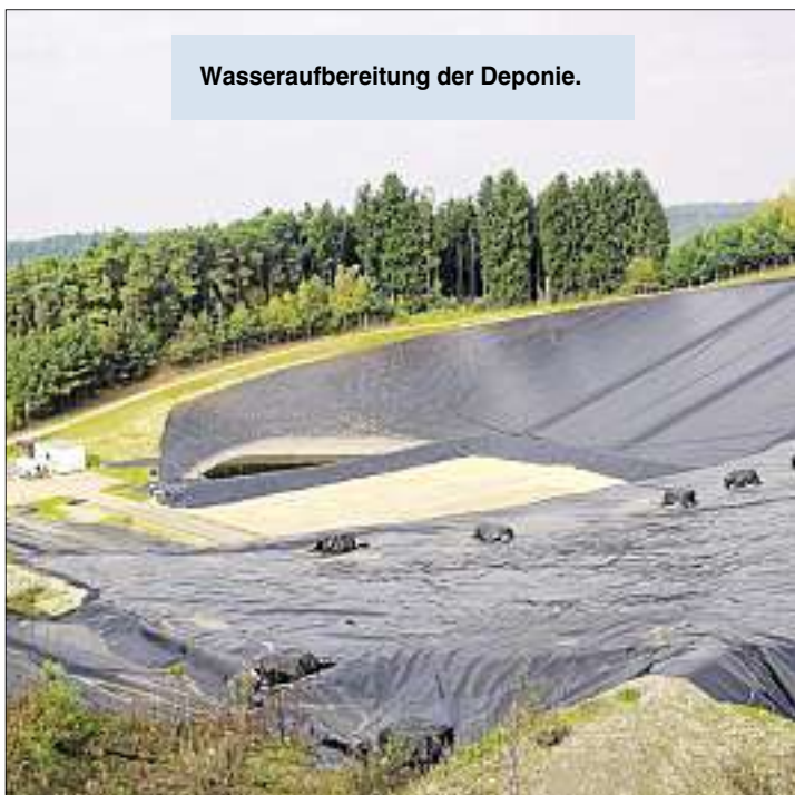
Wasseraufbereitung der Deponie.

Mülldeponien werden weniger – und grüner