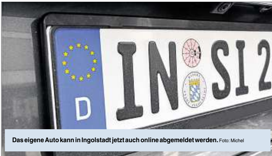
Das eigene Auto kann in Ingolstadt jetzt auch online abgemeldet werden.

Heutzutage ist jeder online – auch das Ingolstädter Rathaus. Eine ganze Reihe Dienstleistungen können bereits über das Internet erledigt oder zumindest in Auftrag gegeben werden. Dieses neu-deutsch „eGovernment“ genannte Angebot wird jetzt weiter ausgebaut. Als erste Behörde in Deutschland können Bürger ihr Fahrzeug ab sofort schnell und einfach online abmelden. Zwei Jahre lang lief bereits eine Testphase in Kooperation mit Audi: Das Unternehmen konnte seine Dienstfahrzeuge über das Verfahren online außer Betrieb setzen. Das klappte gut, und so kommen jetzt alle Ingolstädter in den Genuss dieses neuen Services – früher als alle anderen in Deutschland!