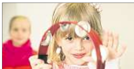
Spielerisch lernen die Kleinen den Umgang mit Musik.

Die Musikschule ist auch Heimat von rund 25 Ensembles und Musikgruppen aus unterschiedlichen Stilrichtungen, etwa dem Volksmusikensemble, der Jazz- und Bigband, der Rockgruppe, dem Drumcircle und dem Gospelchor. Bei allen Musikgruppen kann auch teilnehmen, wer keinen Unterricht an der Musikschule besucht. Ihr Können zeigen die Gruppen regelmäßig bei Konzerten und Auftritten. Zu den Höhepunkten gehört zweifelsohne das Adventskonzert, das heuer am 7. Dezember (17 Uhr, St. Matthäus) stattfindet. Weniger besinnlich dürfte hingegen das Faschingskonzert am 8. Februar (16 Uhr, Aula der Berufsschule) werden. Die Simon-Mayr-Sing- und Musikschule ist auch Organisator und Ausrichter des Regionalwettbewerbs von „Jugend musiziert“ für die Region 10. Der nächste Wettbewerb findet am 31. Januar zwischen 8 und 16 Uhr in der Musikschule im Turm Baur sowie in der Leo-von-Klenze-Berufsschule statt. Die Preisträger sind schließlich bei einem Konzert am 1. Februar (11 Uhr, Aula der Berufsschule) zu erleben. Die Termine kommender Konzerte und Veranstaltungen sowie alle wichtigen Informationen und Kontaktdaten sind im Internet unter www.musikschule.ingolstadt.de abrufbar.