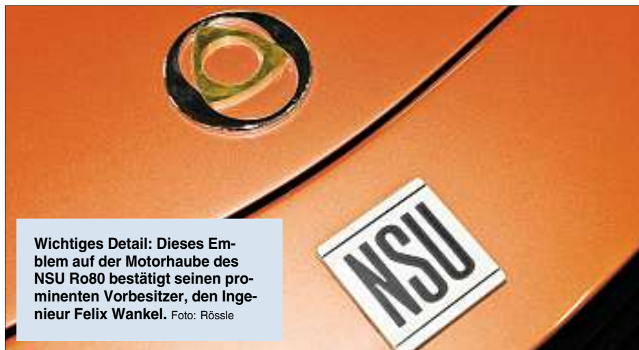
Wichtiges Detail: Dieses Emblem auf der Motorhaube des NSU Ro80 bestätigt seinen prominenten Vorbesitzer, den Ingenieur Felix Wankel.