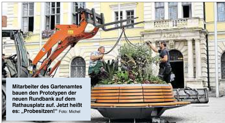
Mitarbeiter des Gartenamtes bauen den Prototypen der neuen Rundbank auf dem Rathausplatz auf. Jetzt heißt es: „Probesitzen!“

Lösel: „Wir haben in den vergangenen Monaten deutliche Fortschritte gemacht. Zum einen wurde bereits zu Beginn des Jahres die Außengastronomie des Café Moritz durch eine weitere Sonnenschirm- und Sitzreihe ausgeweitet. Das sieht nicht nur gut aus, sondern wird von den Bürgern auch sehr gut angenommen. Darüber hinaus haben wir auf der Südseite des Rathausplatzes vor dem Juweliergeschäft zwei weitere Bäume aufgestellt, die den Süden des Rathausplatzes abschließen sollen. Das passt sehr gut, gibt es doch auf der gegenüberliegenden Straßenseite vor der Sparkasse schon länger eine solche Baumreihe. Nun ist ein ‚grünes Tor‘ entstanden. In der Mitte der zwei neu gepflanzten Platanen ist vor Kurzem eine längliche Sitzbank aufgestellt worden. Eine weitere Bank befindet sich weiter oben auf der Westseite. Die neuen Bänke entsprechen im Design den Bestandsbänken und