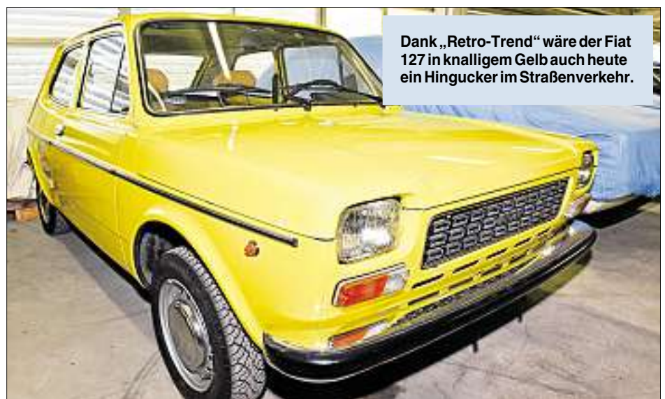
Dank „Retro-Trend“ wäre der Fiat 127 in knalligem Gelb auch heute ein Hingucker im Straßenverkehr.