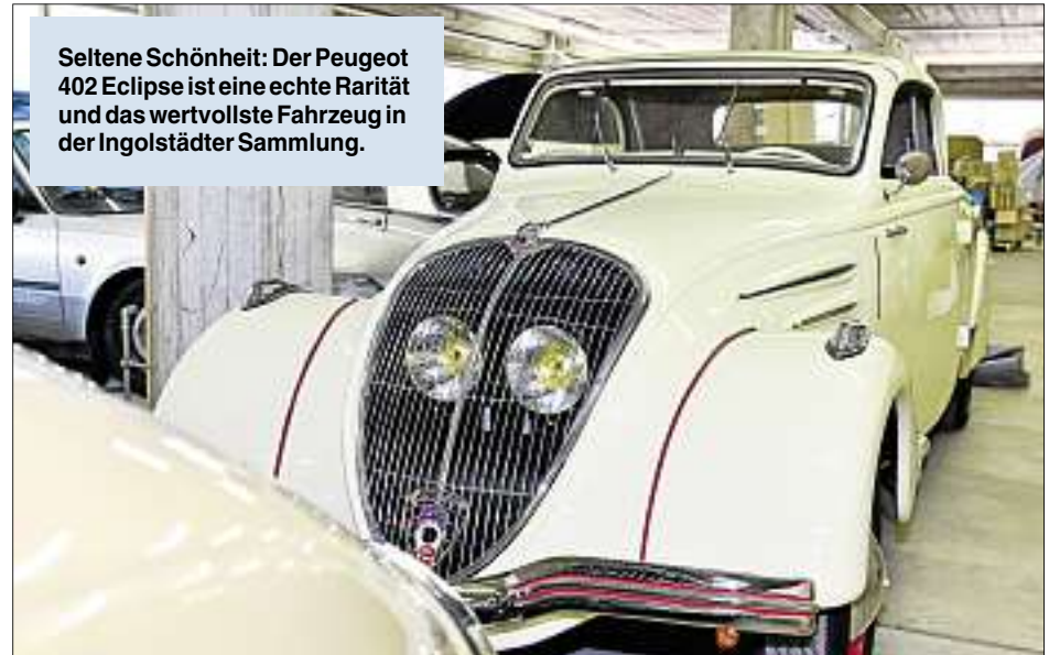
Seltene Schönheit: Der Peugeot 402 Eclipse ist eine echte Rarität und das wertvollste Fahrzeug in der Ingolstädter Sammlung.