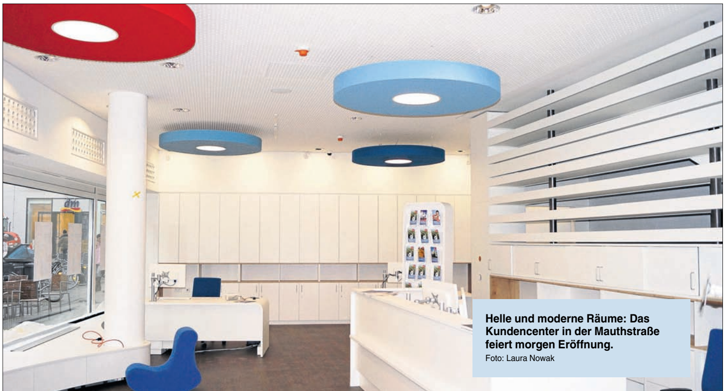
Helle und moderne Räume: Das Kundencenter in der Mauthstraße feiert morgen Eröffnung.

Fünf städtische Dienstleister künftig in der Mauthstraße: Buntes Programm zur Eröffnung am 23. März