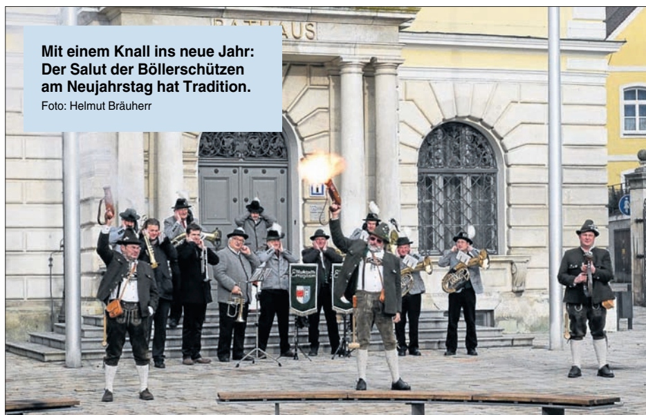
Mit einem Knall ins neue Jahr: Der Salut der Böllerschützen am Neujahrstag hat Tradition.

Auch heuer veranstaltet die Stadt wieder viele traditionelle Feste. Eine Vorschau