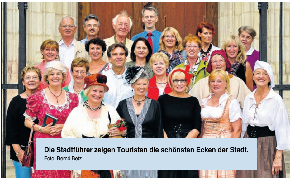
Die Stadtführer zeigen Touristen die schönsten Ecken der Stadt.