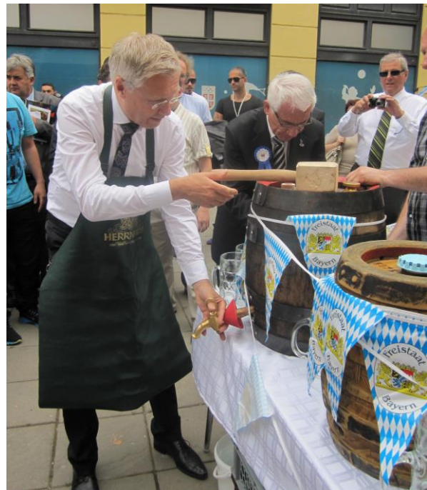
Oberbürgermeister Dr. Alfred Lehmann beim Anstich zum Bierfest in Kragujevac

Die Ingolstädter sorgten auf dem Stadttag in Kragujevac mit der Musikgruppe Schwaiger, einem kleinen Bierfest und einem Infostand für bayerisches Flair.