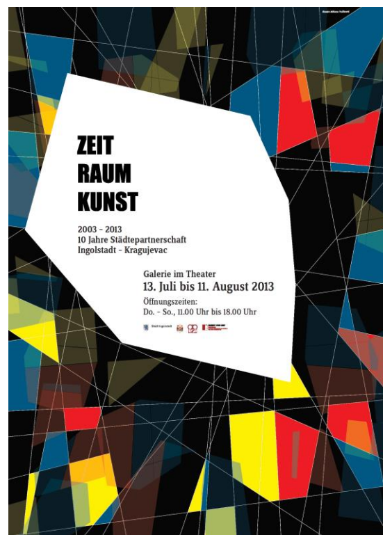
Das Plakat (in Deutsch) zur Ausstellung