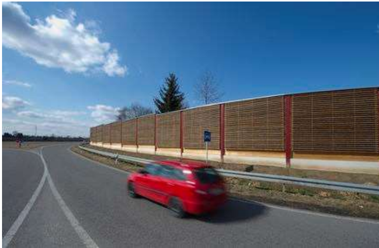
Variante 2, Holzkonstruktion begrünt