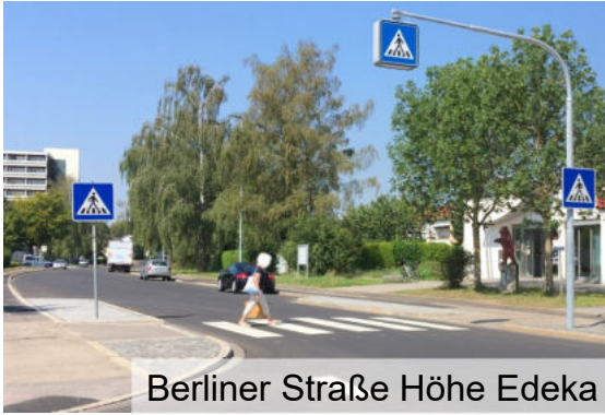
Berliner Straße Höhe Edeka