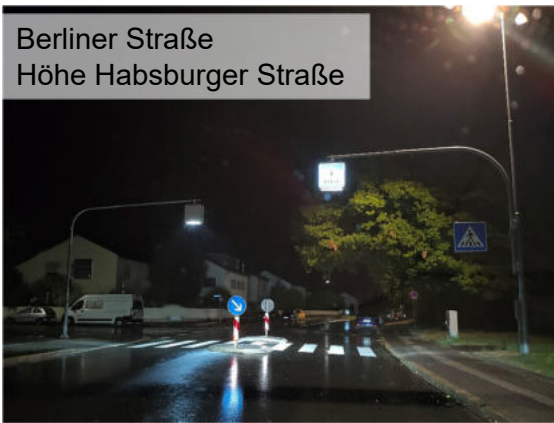
Berliner Straße Höhe Habsburger Straße