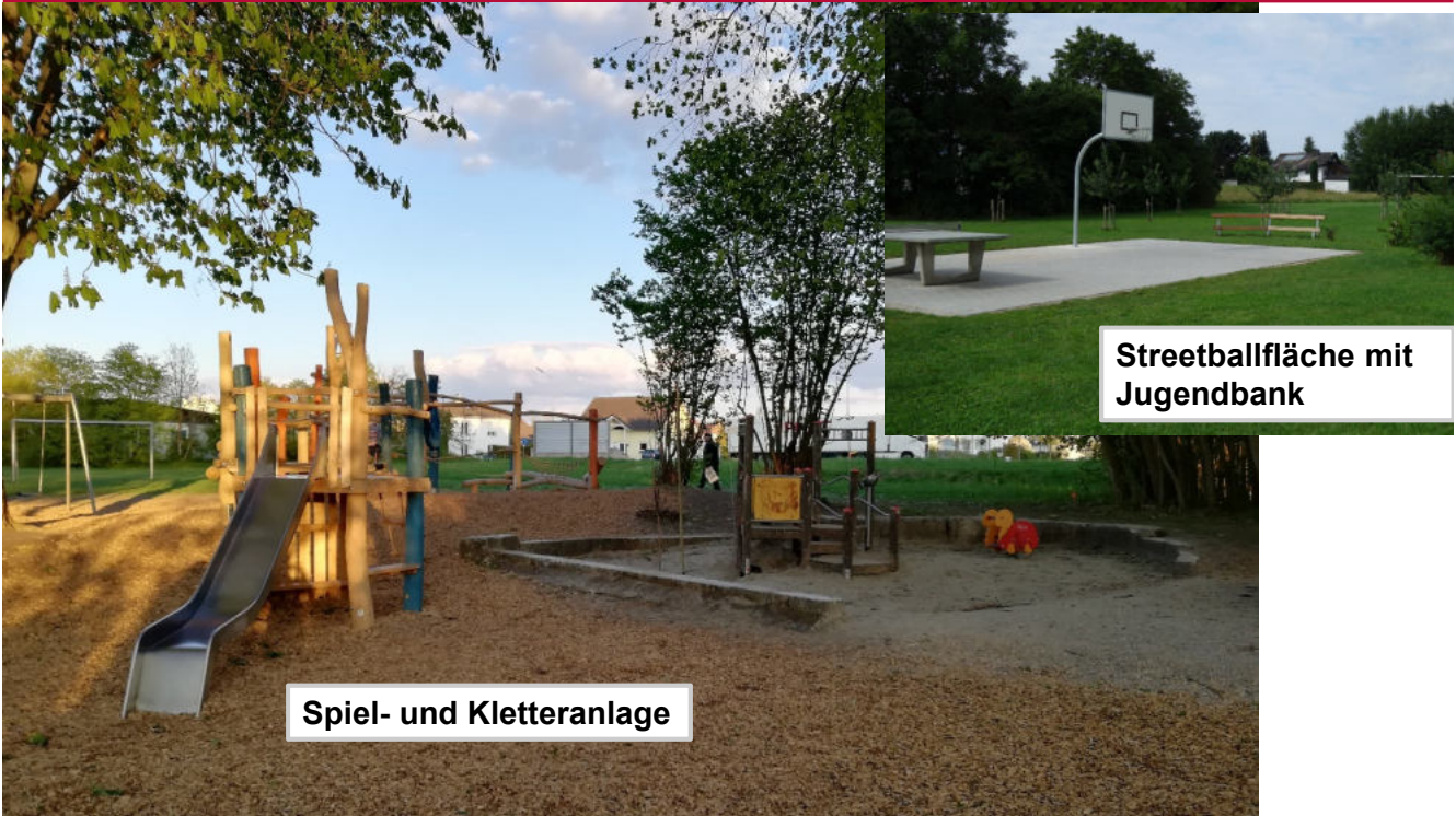
Spiel- und Kletteranlage