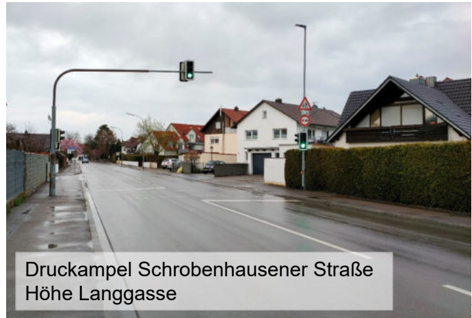
Druckampel Schrobenhausener Straße Höhe Langgasse