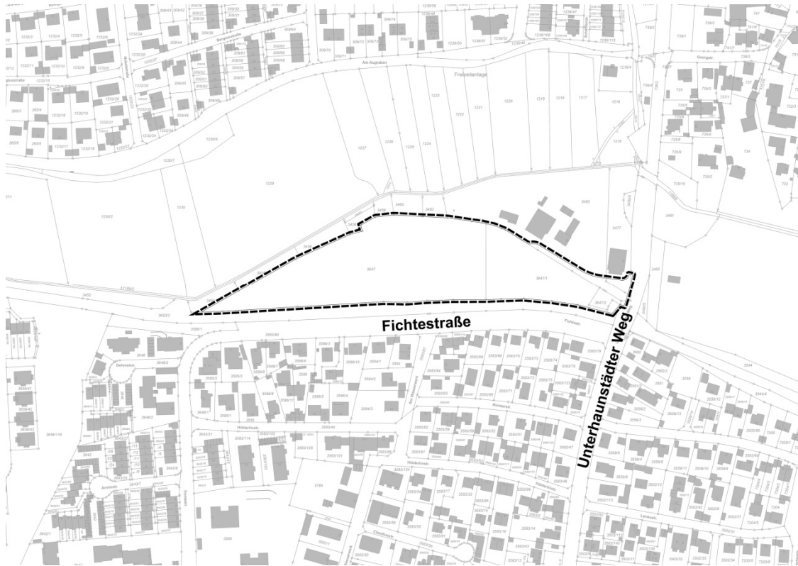
Lageplan zum Bbauungs- und Grünordnungsplan Nr. 613 Ä I „Mittelschule Nord-Ost – südlich Aufraben“