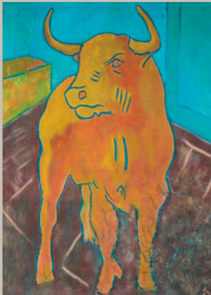
Pete Kilkeny Yellow Bull

Und schwungvoll jugendlich geht es am Sonntag weiter mit den Streichhölzern .